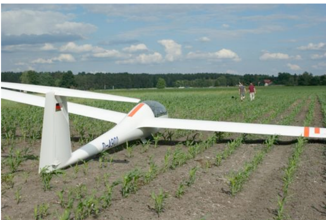
Bild 4: Außenlandung südlich von Schwandorf in östlicher Richtung