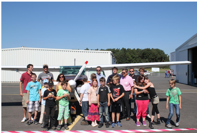
Gruppenbild der 14 Schüler, Betreuer, Helfer und Piloten vom Flugtag in Herzogenaurach am 3. September 2011