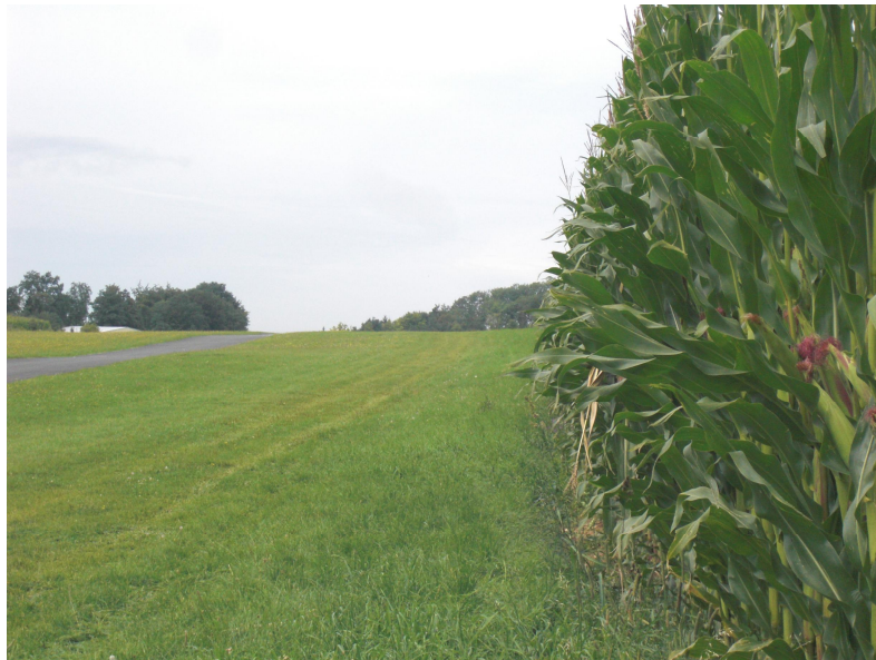
„Maiswand“ an der Platzgrenze

Im August kamen Vertreter des Luftamtes Nordbayern zu einer routinemässigen Platzbegehung auf den Hetzles. Sie bemängelten die Existenz des Maisfeldes, das im Nordostbereich nahezu unmittelbar an die Startbahn grenzt. Der Mais stellt ein erhebliches Sicherheitsrisiko für den Flugbetrieb dar. Nach den luftrechtlichen Bestimmungen muß ein Streifen von 15 Metern neben unserer Startbahnbegrenzung „überrollbar“ sein, was bei über 2,5 Meter hohen Maispflanzen bestimmt nicht der Fall ist.