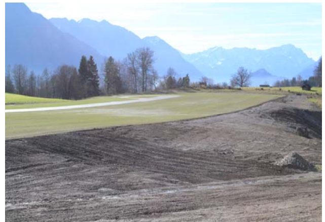
... und die neue Piste in Pömetsried

die umstrittene luftrechtliche Betriebserlaubnis für das anvisierte neue Gelände in Ohlstadt-Pömetsried zugestanden hatte. Der Genehmigung war ein jahrelanger „Hickhack“ voraus gegangen. Ein zum Zweck der Verhinderung des Projekts entstandenes "Bündnis zum Erhalt Pömetsrieds" sah die Tuffsteinquellen und Vogelarten in Gefahr. Die Segelflieger, deren Pachtvertrag in Eschenlohe 2011 ausläuft, wären ohne das neue Areal alternativlos. Vor dem Mittagessen konnten die Delegierten per kostenlosem Busshuttle und bei trockenem Wetter das neue Segelfluggelände "Pömetsried" besichtigen.