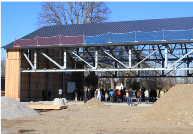
Blick auf die neue Flugzeughalle