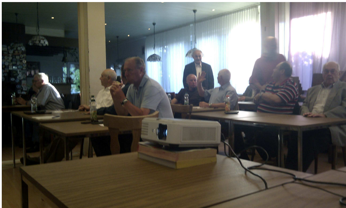
Nur wenige Mitglieder besuchten die Jahreshauptversammlung am 4. Mai

bekanntlich hat am 4. Mai die Jahreshauptversammlung unseres Vereins stattgefunden. Neben den 6 Vorstandsmitgliedern, die über das letzte Vereinsjahr berichtet haben, waren noch weitere 25 Mitglieder (von insgesamt 315) gekommen. Wie auf der Tagesordnung vermerkt, standen eine Vielzahl von Neuwahlen an. Dabei zeigte sich eine Brisanz, die mir selbst vorher auch nicht so klar war.