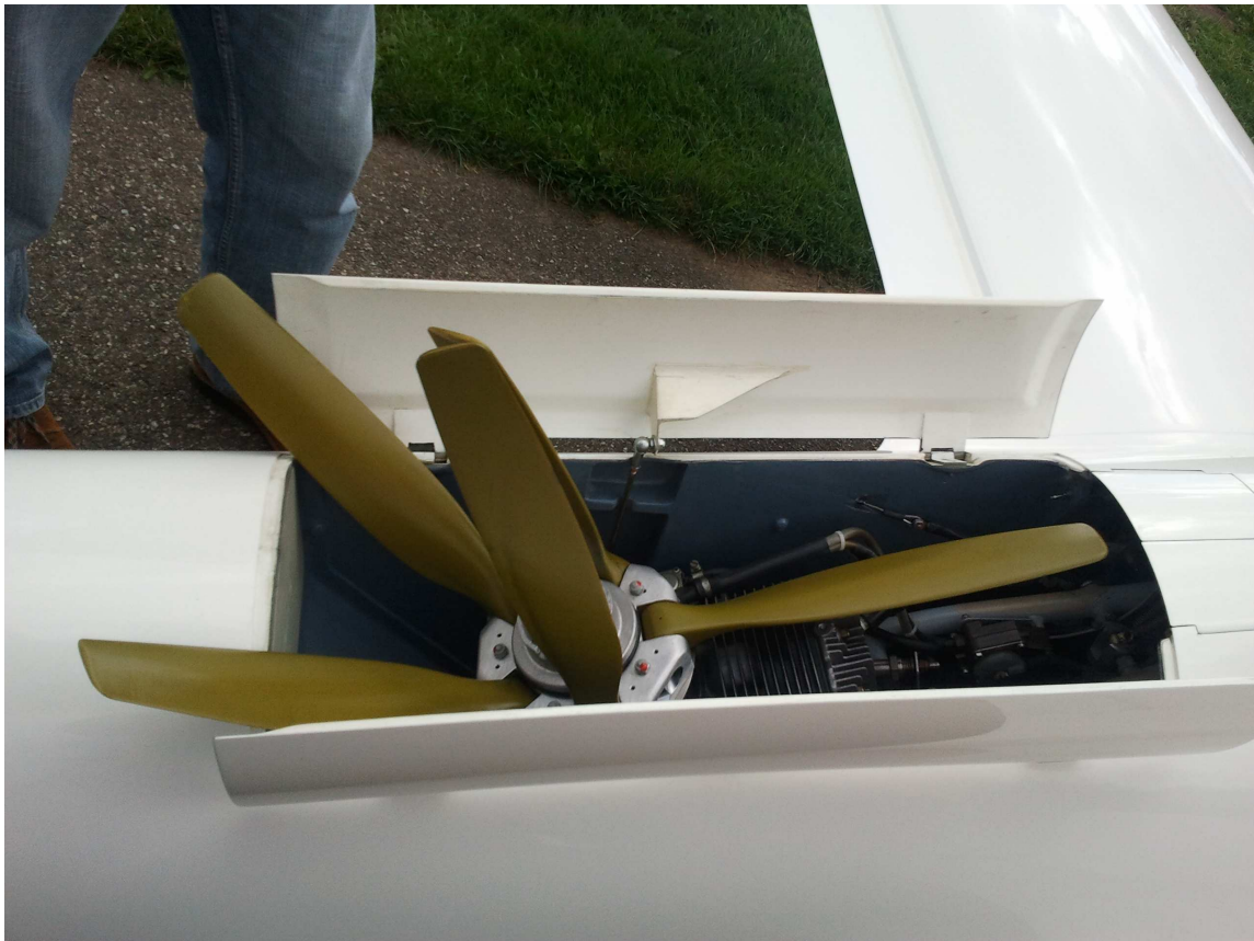
Turbomotor mit 5-blättrigem Faltpropeller“

Unser neuer Einsitzer „Discus 2cM“ wird in der letzten Juniwoche auf dem Hetzles eintreffen. Es ist der erste Segler mit Klapptriebwerk, den die Segelfluggruppe ihren Mitgliedern zur Verfügung stellt.