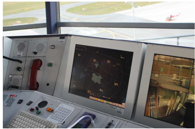
Blick auf die zahlreichen Flugüberwachungseinrichtungen des Tower EDDN

Allein die Technik im Tower hatte dabei einen Wert von 22' Mio. DM. Hinzu kommen die technischen Außenanlagen, die zur Flugsicherung notwendig sind. Besetzt ist der Tower normalerweise mit 2 Fluglotsen, die rund um die Uhr im Jahr ca. 80.000 Flugbewegungen kontrollieren und koordinieren.