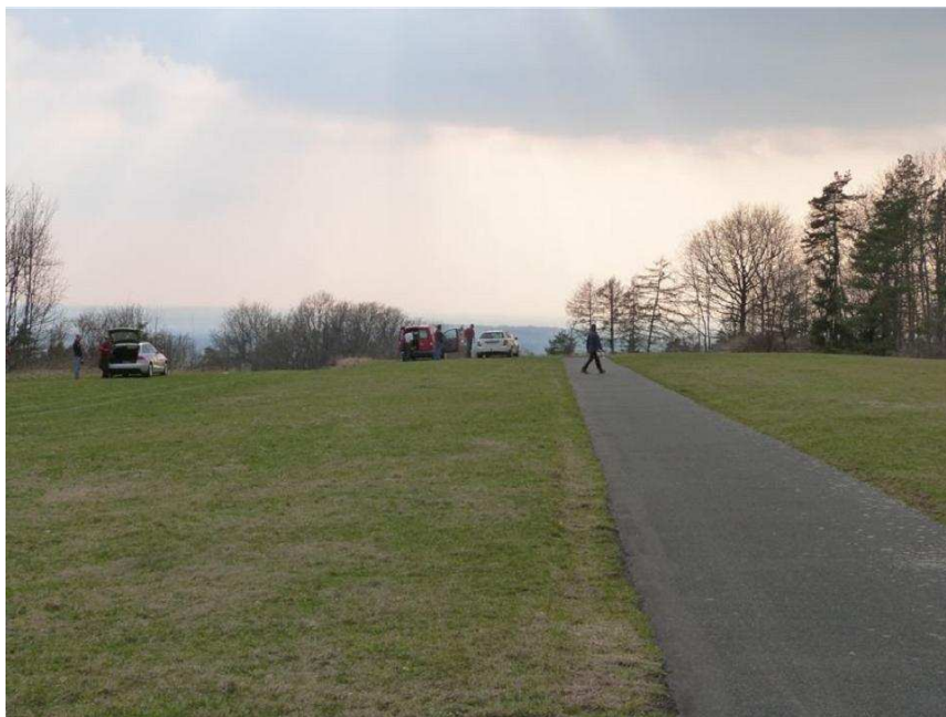
„Freier Abflug in Richtung Westen“

Mit dem Einverständnis der Gemeinde Hetzles konnte nun der Großteil der Bäume westlich des Flugplatzes komplett entfernt werden. Dies geschah im Frühjahr durch eine Fachfirma, die mit schwerem Gerät anrückte. Den Rest erledigten zahlreiche Mitglieder unserer beiden Segelfluggruppen. Im Ergebnis lässt sich der Flugzeugschlepp nun erheblich komfortabler gestalten.