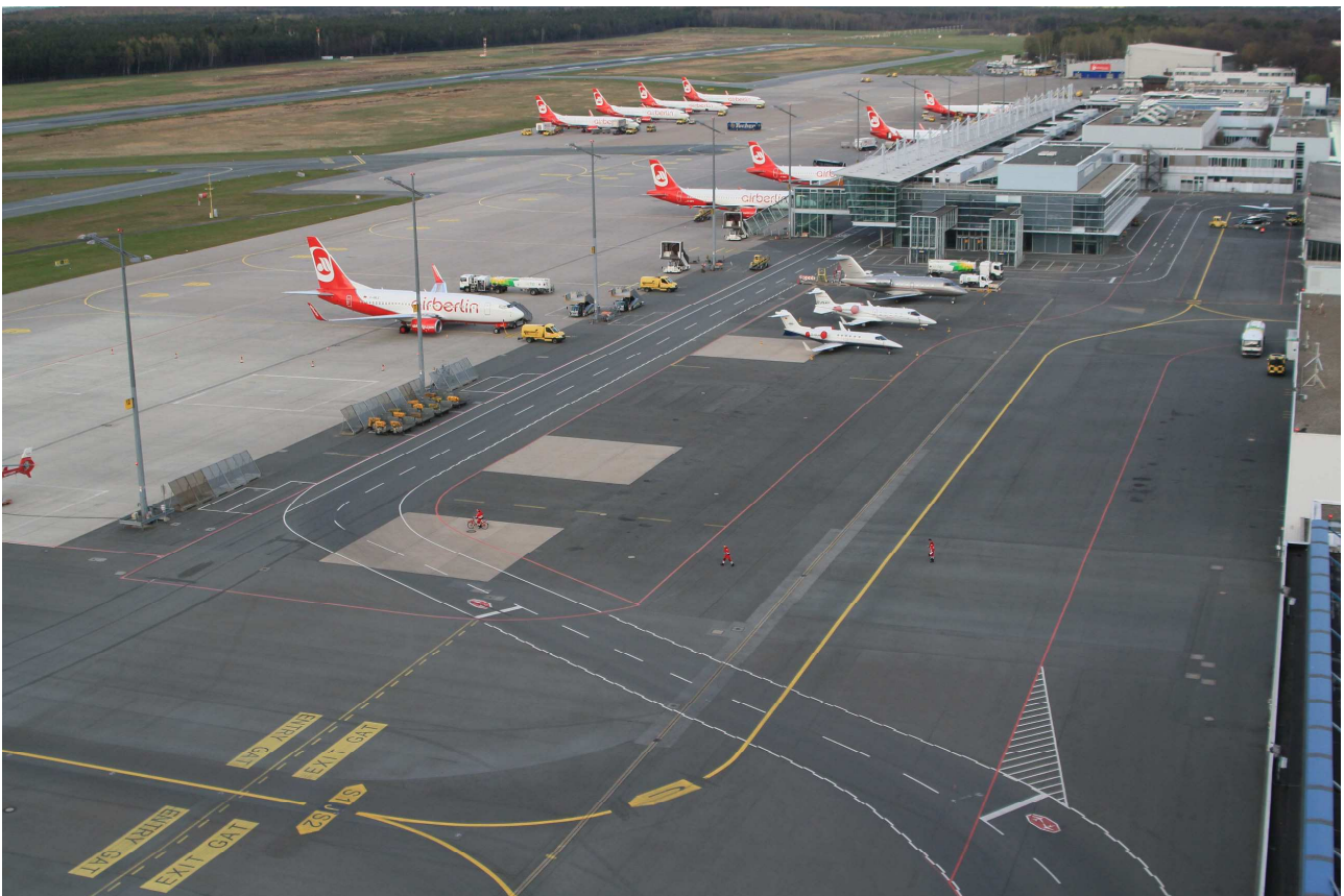
Blick vom Tower in östliche Richtung auf das Vorfeld des Verkehrsflughafens EDDN

Wir alle sollten stets die Anweisungen der Fluglotsen genau befolgen und lieber nochmals nachfragen. Je professioneller wir Kontakt aufnehmen, desto besser.